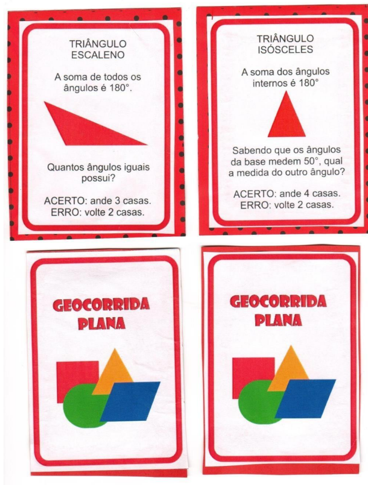
Figura 2 – Cartinhas do jogo com as perguntas

Em um primeiro instante, a atividade é apresentada aos alunos e uma explicação do contexto histórico abordando a essência do nome Geocorrída Plana. Logo após, é apresentado aos alunos um recipiente contendo inúmeras bolinhas ou fichinhas. Em cada bolinha/fichinha existe a representação de uma figura geométrica plana. Ao tirar uma bolinha aleatória do recipiente, o aluno verá qual é a figura geométrica da bolinha (círculo, quadrado, retângulo, losango, paralelepípedo, trapézio, triângulo equilátero, triângulo isósceles, triângulo escaleno e triângulo retângulo) e irá retirar da pilha de cartas a carta correspondente à respectiva figura geométrica desenhada na bolinha. Nessa carta é apresentada alguma informação sobre o determinado polígono (ou sobre o círculo), uma espécie de curiosidade para que o aluno vá agregando com o decorrer do jogo, diversas informações sobre os polígonos regulares e/ou irregulares e sobre o círculo. Abaixo desta “curiosidade” apresentada está a pergunta que o jogador deverá responder como mostra a figura 2. A pergunta é feita pelo professor mediador do jogo, neste caso ele irá dizer se a resposta do aluno está correta ou não. Se o aluno errar ou acertar a pergunta, na cartinha estará indicado o que ele deverá fazer no tabuleiro da Geocorrída Plana (Figura 2). Vence aquele que chegar primeiro ao fim do trajeto.