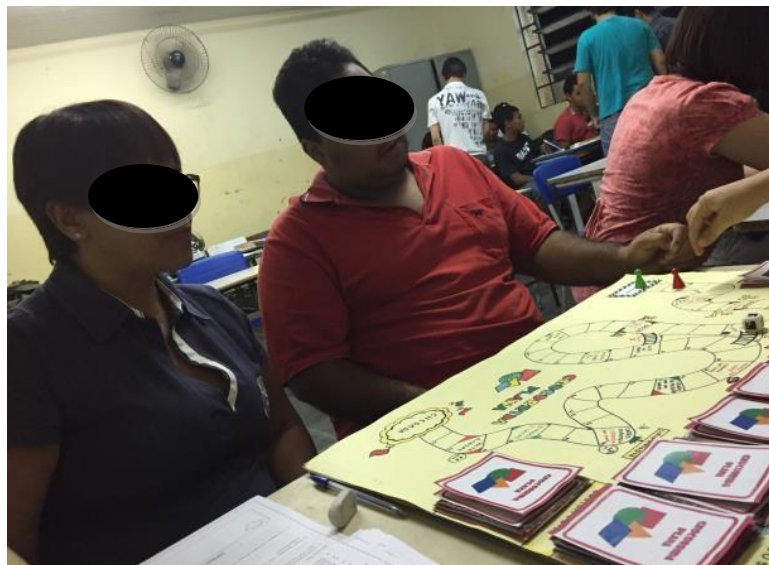
Figura 3 – Aluna A e Aluno B jogando – Escola Estadual Nanhá do Couto

Outro ponto que foi notável na nossa experiência foi perceber que os alunos são ensinados seguindo um modelo tradicional que se baseia em um método de memorização. Chegamos a tal conclusão por uma observação feita aos alunos na qual eles conheciam algumas figuras, mas não sabem os seus nomes específicos e nem as suas características.